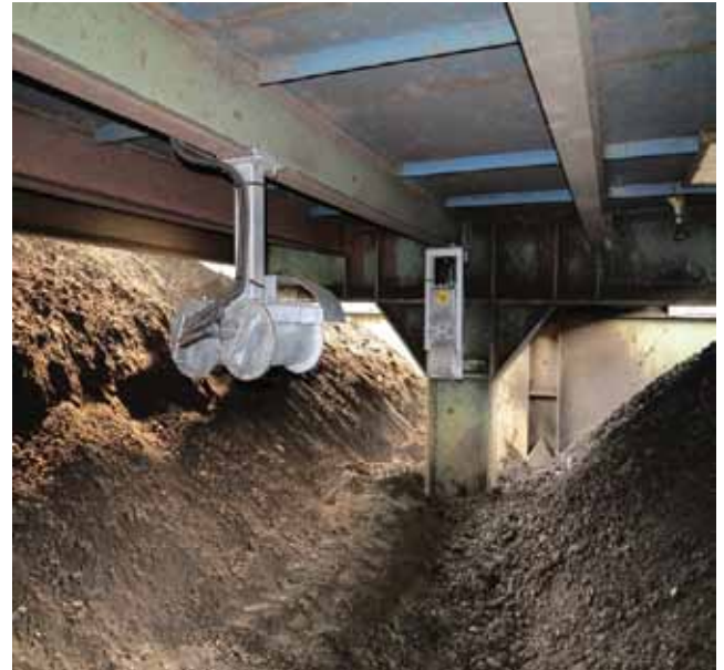
System monitorujący zapylenie w kopalni. Detektor oraz emiter promieniowania (wykonanie ATEX).

Wygodny nadzór nad mierzonymi parametrami. Możliwość podłączenia wielu urządzeń. Kontrola wielu parametrów procesu.