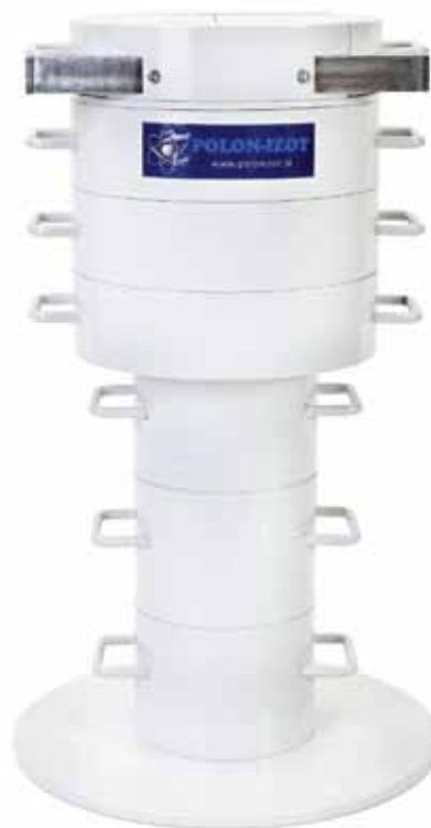
Widok ogólny analizatora.