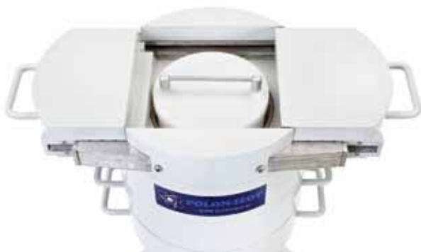
Widok komory pomiarowej z pojemnikiem zawierającym badaną próbkę przed jej zamknięciem.

Istotnym elementem systemu pomiarowego jest komora pomiarowa mieszcząca się w specjalnej ołowianej konstrukcji zwanej domkiem pomiarowym. Domek składa się z szeregu ruchomych, nakładanych na siebie warstw pierścieni ołowianych. To unikatowe rozwiązanie gwarantuje, że cała konstrukcja może być transportowana przez jedną osobę. Po zmontowaniu domek jest stabilny i waży około 260 kg.