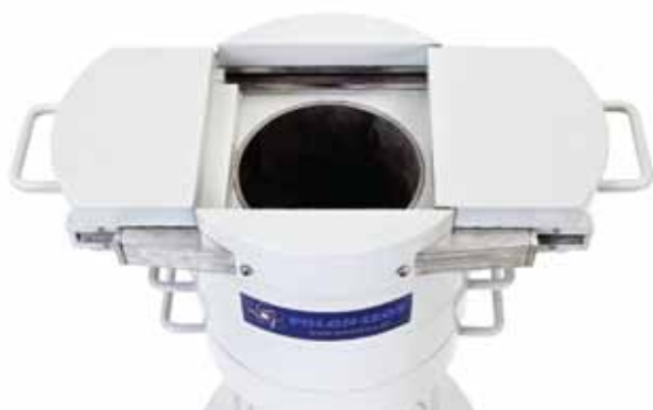
Widok komory pomiarowej.