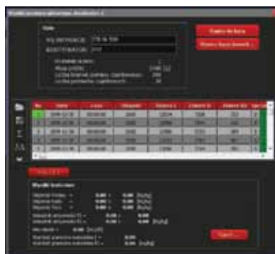
Widok okna z widmami i wynikami

POLON-IZOT jest polskim producentem sprzętu pomiarowego dla laboratoriów i przemysłu. Jesteśmy kontynuatorem działalności znanej w świecie firmy POLON Zjednoczone Zakłady Urządzeń Jądrowych, założonej w 1956 roku i funkcjonującej jako Biuro Urządzeń Techniki Jądrowej. Możemy się zatem poszczycić ponad 60-letnim dorobkiem technicznym.